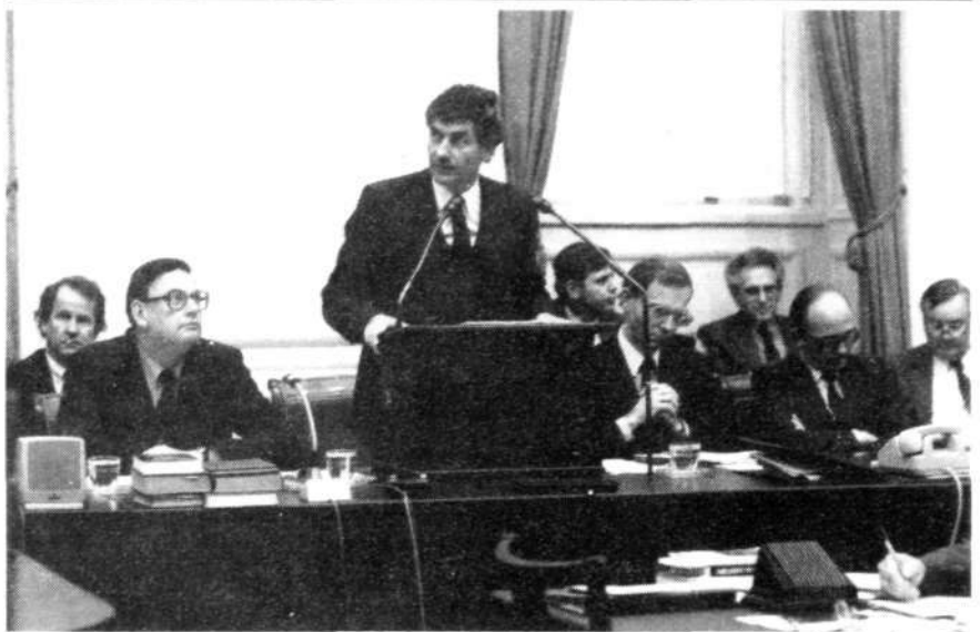
'Ook zal op alle terreinen van de samenleving discriminatie van mensen op grond van sekse, leefvorm of seksuele voorkeur worden bestreden. Een wetsontwerp ter bestrijding van sekse-discriminatie in ruime zin zal daartoe worden ingediend'

De afkondiging en inwerkingtreding van de algeheel herziene Grondwet vindt plaats als de bij de Eerste Kamer aanhangige wetsontwerpen tot aanpassing van enkele ongewijzigd gebleven bepalingen aan de reeds aangenomen herzieningsvoorstellen zullen zijn aanvaard. In deze kabinetsperiode moet met de uitvoeringswet-