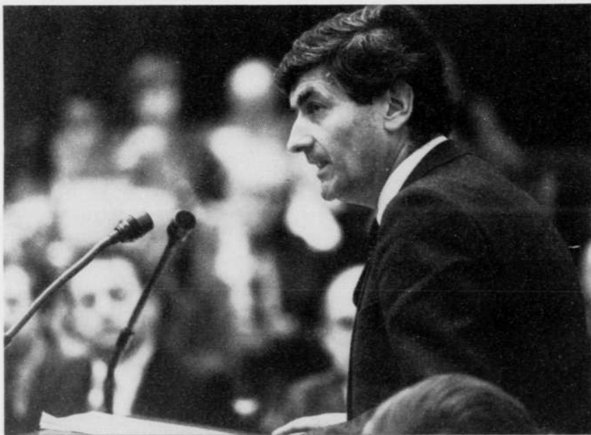
'Een goede kwaliteit van de leefomgeving blijft voor de Regering een primaire doelstelling'

Met spoed wordt een Beheerswet voorbereid, voor het bereiken van agrarische bedrijfsvoering die mede is