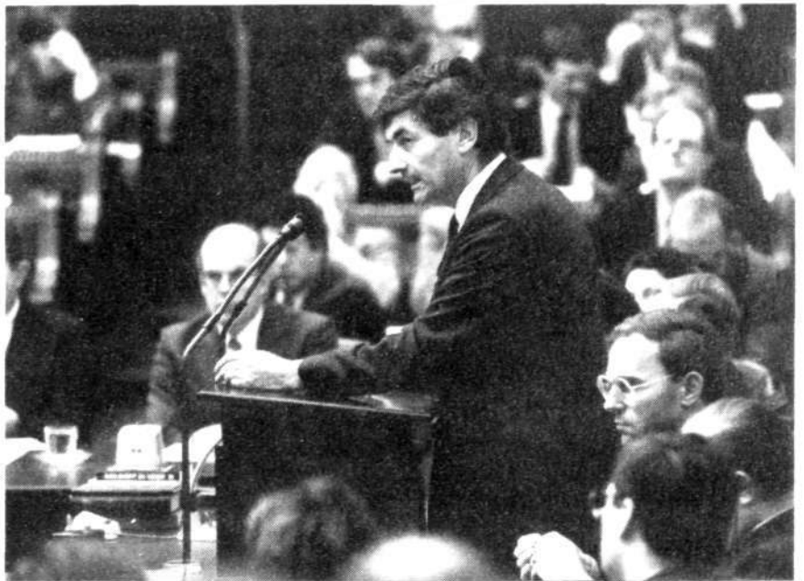
'De tarieven bij de NS zullen gemiddeld met 8% omhoog gaan en bij het streek- en stadsvervoer met gemiddeld 13%'

De tarieven bij de NS zullen gemiddeld met 8% omhoog gaan en bij het streek- en stadsvervoer met gemiddeld 13%. Deze verschillen vinden hun grondslag in de uiteenlopende bijdragen in de kosten die de reiziger