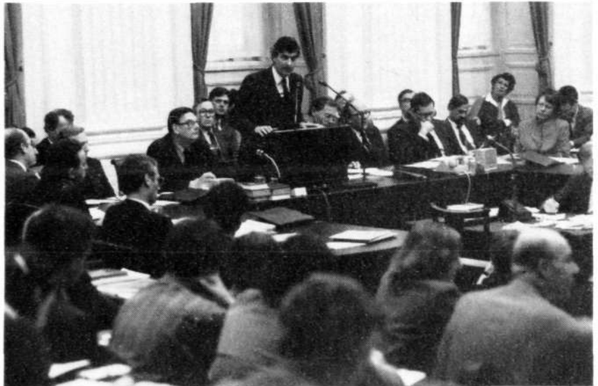
'Het streven van de Regering is, naast bevordering van de START- en MBFR-besprekingen, vooral gericht op het voorkomen van de plaatsing van nucleaire middellange-afstands-raketten in West-Europa en daaraan gekoppeld de ontmanteling van dezelfde soort wapens aan de kant van de Sovjet-Unie'

Daar alles aan te doen, is wat de deelnemers aan de vredesdemonstratie van 21 november en al die andere voor de vrede biddenden vragen. Daartoe is ook een politiek klimaat van rationele beheerste verhoudingen noodzakelijk. Daarin passen geen concepties van politieke superioriteit en militair machtsvertoon. Nederland