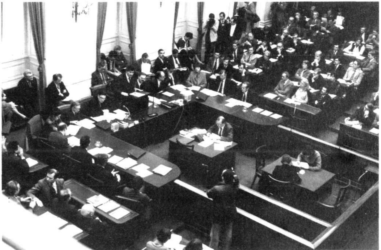
Minister-President Lubbers leest de Regeringsverklaring voor

Mijnheer de Voorzitter! In ons staatsbestel neemt de Minister-President bij zijn ambtsaanvaarding zoveel mogelijk de verantwoordelijkheid voor informatie en formatie op zich. De kern van die verantwoordelijkheid ligt in de aanvaarding van de formatieopdracht. Immers, het aanvaarden daarvan betekent dat de formateur dit verantwoord acht, mede in het licht van de conclusies van de voorafgaande informatieperiode. De formatie die geleid heeft tot het stand komen van dit kabinet, is voor Nederlandse verhoudingen snel te noemen. Dat mocht ook wel na de voorgeschiedenis sinds 26 mei 1981. Dank past hier aan informateur Van Kemenade, die snel en doelmatig heeft gewerkt. Doelmatig, waar hij zich met name tot taak